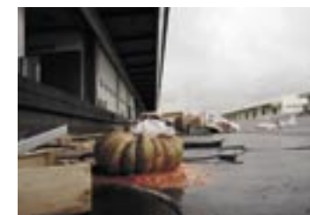
Jeg fandt de fire kartofler bag det smadrede græskar.