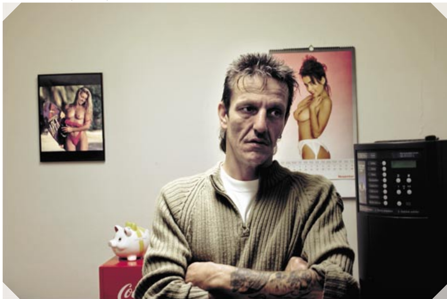
Rotteborgen. Paris' fragtterminal ligger lige på den anden side af hækken.