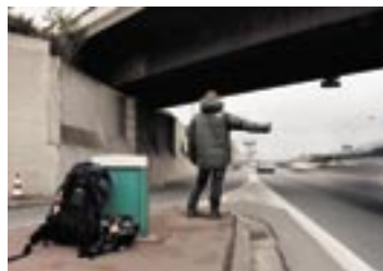
Ved fragtterminalen i Paris. Det er første gang, jeg stikker min arm ud på turen.